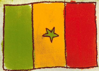
Voici le drapeau du Sénégal.